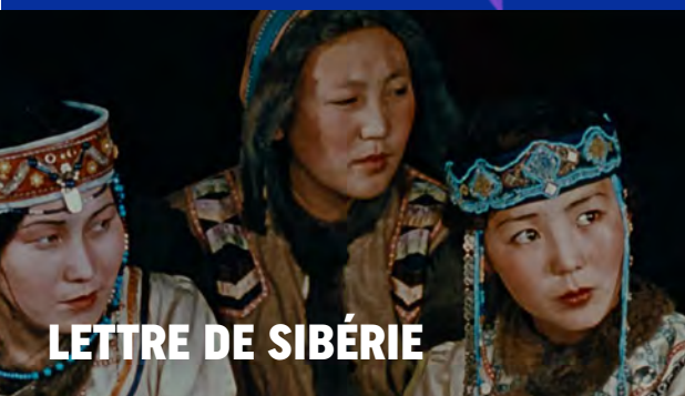
LETTRE DE SIBÉRIE

SINOPSIS: Laura recibe el encargo de terminar el guion de un videojuego dedicado a la batalla de Okinawa (tragedia casi desconocida en Occidente, pero determinante en el fin de la Segunda Guerra Mundial). El objetivo del juego no consiste en modificar el curso de la Historia, sino reproducirla tal y como fue. Pero, al trabajar sobre Okinawa, Laura se topará en Internet con una misteriosa red paralela de informadores y testigos de la batalla. Así, conocerá aspectos de la tragedia que empezarán a interferir en su propia vida. Como todos los videojuegos, Level Five avanza por niveles. Laura y su interlocutor, intoxicados por su misión, acabarán por componer una metáfora de la vida, distribuyendo los "niveles" a todo lo que les rodea. ¿Alcanzará Laura el Nivel Cinco?