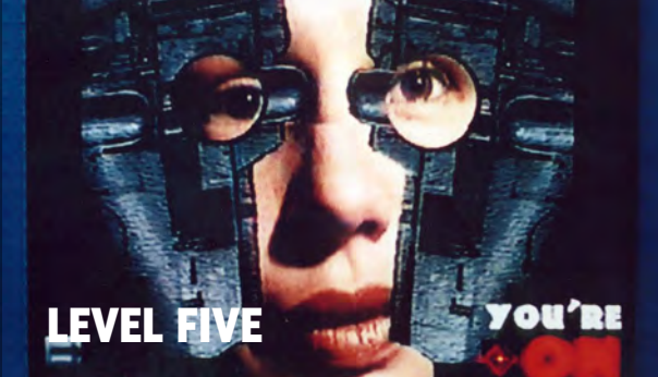
LEVEL FIVE YOU'RE